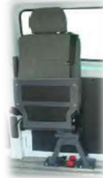
Option siège pivotant